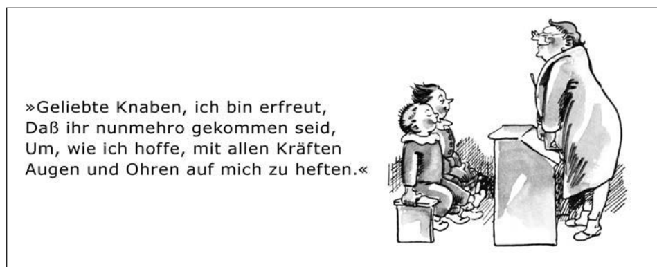
Abb. 1: Plisch und Plum (Wilhelm Busch)

Wilhelm Busch beschreibt und illustriert in seiner Geschichte von Plisch und Plum seine Vorstellung von Lehren: