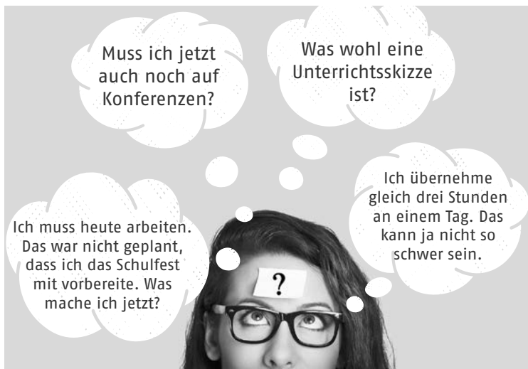
Abb. 2: Zentrale Themenfelder im Schulpraktikum

Die in Abbildung 2 festgehaltenen Gedanken zu verschiedenen Situationen in einem Schulpraktikum fangen die Themenfelder ein, die in der Befragung als zentral hervorgehoben und häufig genannt wurden: