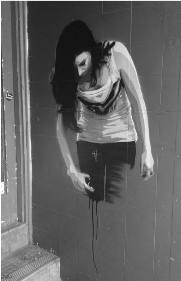
Abbildung 1.2 Identität gestalten

Mit diesem Konzept verbindet sich die Annahme, dass die Auseinandersetzung mit und die erfolgreiche Bewältigung von Entwicklungsaufgaben hilft, Fähigkeiten, Fertigkeiten und Kompetenzen zu erwerben, die im weiteren Entwicklungsverlauf benötigt werden. So stehen für das Erwachsenenalter die finanzielle Versorgung und Sicherung, die Gründung einer eigenen Familie, die Teilnahme am kulturellen Leben und Konsum sowie die politische Partizipation an. Allerdings besteht für die Jugendlichen kaum Druck, da immer mehr junge Menschen weiterführende Schulen besu-