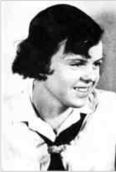
Ulmer BDM-Ringführerin Inge Scholl (ca. 1934)

Heiligen Schrift für ihn eine neue, überraschende Bedeutung, eine ungeheure Zeitnähe und einen ungeahnten Glanz.“ – 1982, S. 27: „... Bedeutung; Aktualität brach durch die alten, scheinbar verdorrten Worte und gab ihnen das Gewicht des Überzeugenden.“