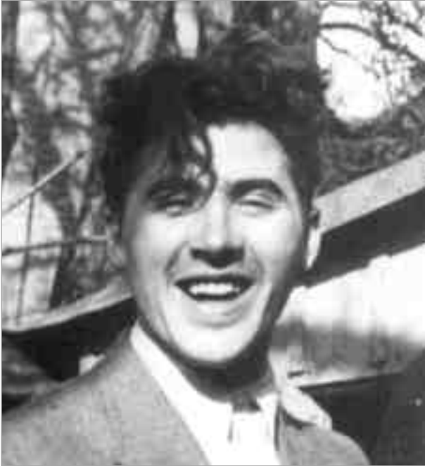
Otto (Otl) Aicher (1922–1991) als Gymnasiast

Exkurs. Dabei hätte grade die Verbindung Otl Aicher–Hans Scholl nach dem Stuttgarter Prozess besonders nahegelegen, weil Aicher knapp einem ähnlichen Schicksal entgangen war. Aicher hatte Kontakt zum katholischen Quickborn und war von Jugend auf ein entschiedener Gegner des NS-Regimes. Eine Verordnung des Württembergischen Innenministeriums vom 8.8.1935 hatte ein „Verbot der außerreligiösen Betätigung in konfessionellen Verbänden“ ausgesprochen (Min. Amtsblatt, S. 206). Im Zuge der Verfolgung „bündischer Umtriebe“ geriet natürlich auch der Quickborn ins Visier der Ermittler. 11 Aicher war mit seinem Freund Ernst Klar am 10.8.1937 in Berlin verhaftet und als 15-Jähriger in der Gestapo-Zentrale Prinz-