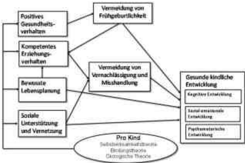
Abbildung 2: Konzeptionelles Modell der Programmwirkung (in Anlehnung an Olds 2007)