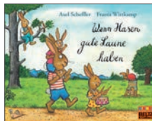
Axel Scheffler / Frantz Wittkamp Wenn Hasen gute Laune haben 978-3-407-76277-1